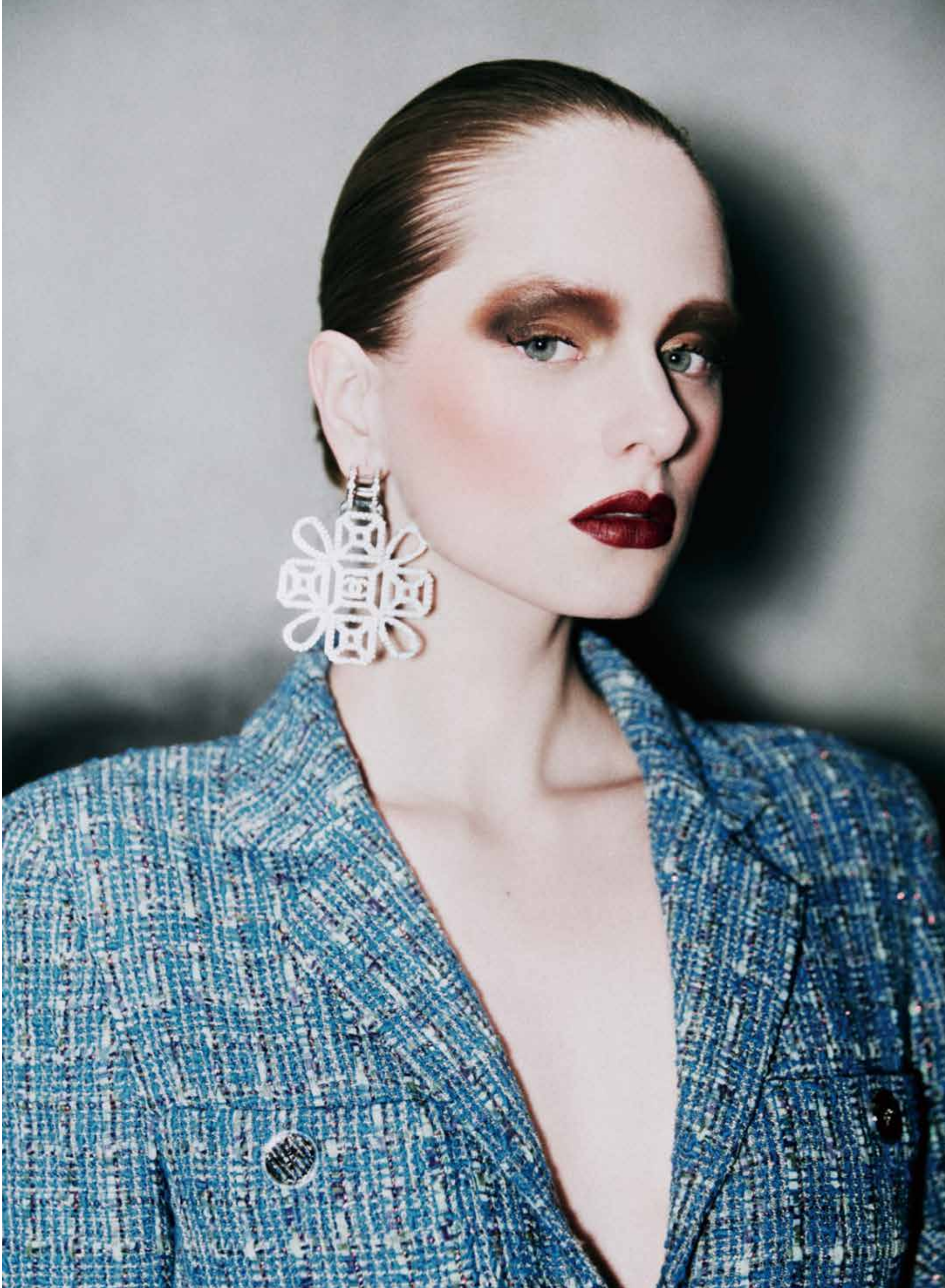
Chanel 蓝色印花呢外套、花型耳坠