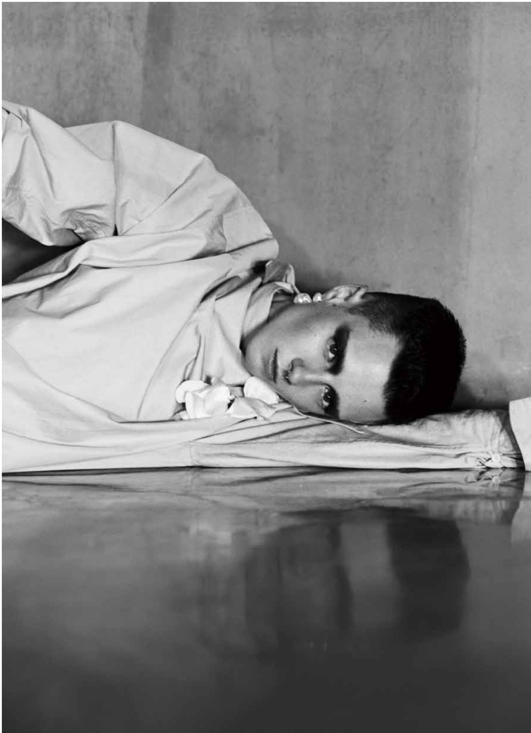
左— Céline 衬衫连衣裙、珍珠耳坠 Lanvin 胸花 右— Saint Laurent 黑色皮质连衣裙、 饰钻耳环